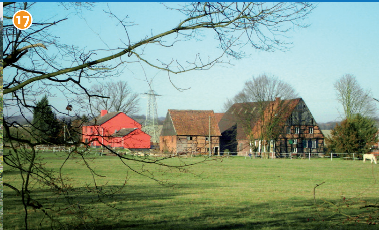
17 Hof Grube - Ältestes Fachwerkbauernhaus Norddeutschlands, dessen Wurzeln vermutlich 1000 Jahre zurück liegen. Die ältesten erhaltenen Bauteile stammen aus dem frühen 16. Jh., die Gebäude befinden sich in privater Hand und werden aktuell umfangreich renoviert.