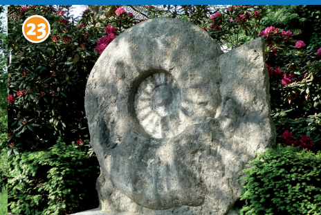
23 Seppenrader Ammonit - Der weltgrößte (!) Ammonit wurde 1895 in der Bauerschaft Leversum gefunden. Eine Nachbildung steht im Dorf, das Original im Naturkundemuseum in Münster.