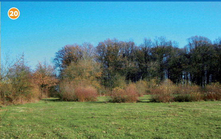
Naturschutzgebiet Lippsches Holt Schutzwürdiger Waldbestand mit einer der wertvollsten Feuchtwiesen im Kreis Coesfeld, über 70 Blütenpflanzenarten.