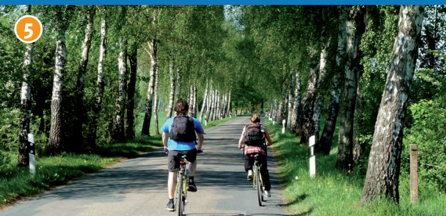
5 Birkenallee in der Bauerschaft Elvert