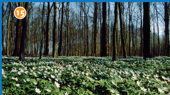
15 Kranichholz - Ein typischer Münsterländer Eichen-Hainbuchenwald mit wunderschönem Blüten Teppich des Buschwindröschens im Frühjahr.