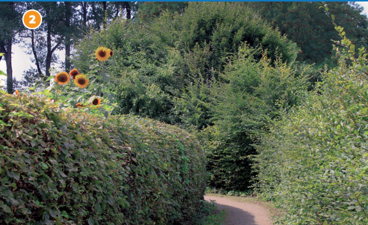
2 Wallgärten um Burg Lüdinghausen - Gärten einer alten Ackerbürgerstadt, durch hohe Hainbuchenhecken gegliedert.