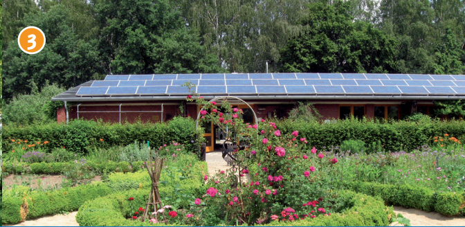
3 Biologisches Zentrum - Umweltpädagogische Einrichtung für den Kreis Coesfeld, mit westfälischem Bauerngarten, alten Obstbäumen und naturnah gestalteten Bereichen.