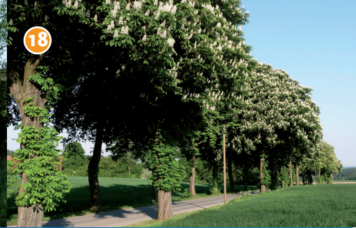
18 Kastanienallee in der Seppenrader Schweiz