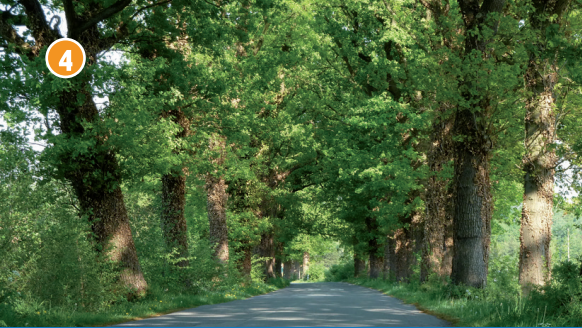
4 Alte Eichenallee im Berenbrock