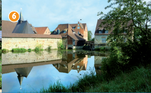
6 Burg Kakesbeck - Eine bereits im Mittelalter erwähnte, vielfach umgestaltete Wasserburganlage (in Privatbesitz - Besichtigung nur nach Anmeldung).