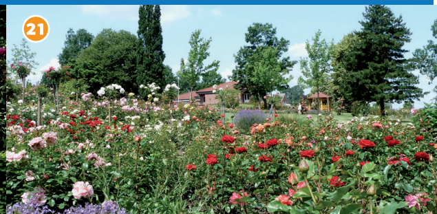
21 Seppenrader Rosengarten - Vor 40 Jahren wurde der Garten von engagierten Bürgern auf einer ehemaligen Mülldeponie angelegt. Er wird bis heute ehrenamtlich gepflegt - über 700 verschiedene Rosensorten sind ein Besuchermagnet.