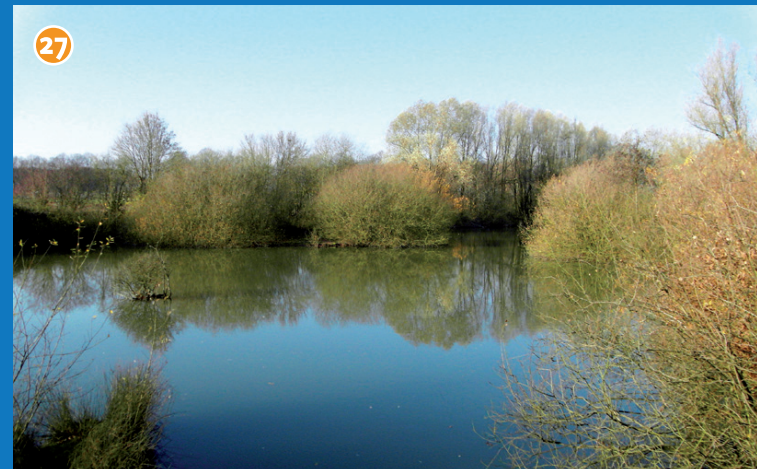
Naturschutzgebiet Plümer Feld Verwunschene, reich strukturierte ehemalige Tongrube, Amphibien-Vorkommen mit Laubfrosch und sieben weiteren Arten. Ehrenamtlich betreut.