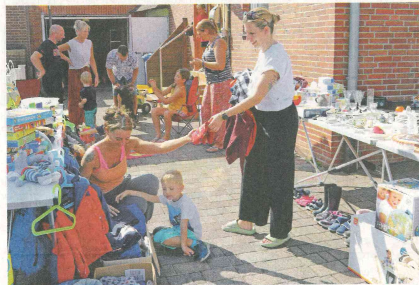
170 Haushalte haben sich am 1. Trödeltag im Rahmen der Klimaschutzwoche beteiligt.