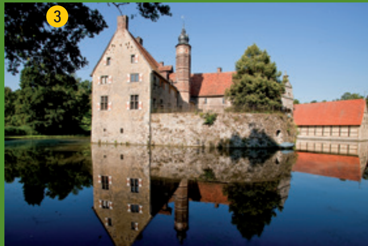
Burg Vischering – eine der schönsten Wasserburgen Deutschlands. Erstmals 1271 erwähnte Ringmantelburg mit Vorburg und weitläufigem Gräftensystem. Heute Münsterlandmuseum, mit wechselnden Ausstellungen in der Remise und Café in der Vorburg.