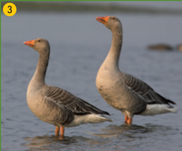
Graugänse brüten an den Gräften der Burg Vischering. In unserer Gegend ursprünglich für jagdliche Zwecke ausgewildert, haben sie sich weit verbreitet. Sie sind die Stammform der Hausgans.