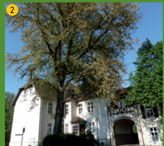
Die stättliche Ulme am Torhaus zur Renaissanceburg Lüdinghausen.

Den GPS-Track finden Sie auf den Internetseiten der verschiedenen Partner des Projektes.