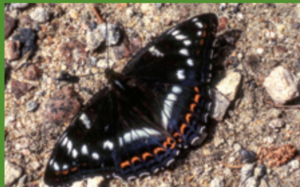
Kleiner Eisvogel – ein wunderschöner Falter der feuchten Laubwälder. Seine Raupen leben am Geißblatt.