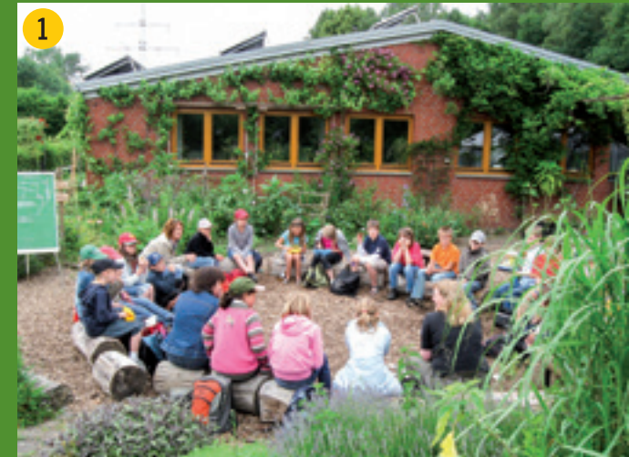
Biologisches Zentrum Kreis Coesfeld steht seit 25 Jahren für Umweltbildung in der Region. Besucher sind herzlich eingeladen! Genießen Sie das Gelände – www.biologisches-zentrum.de .