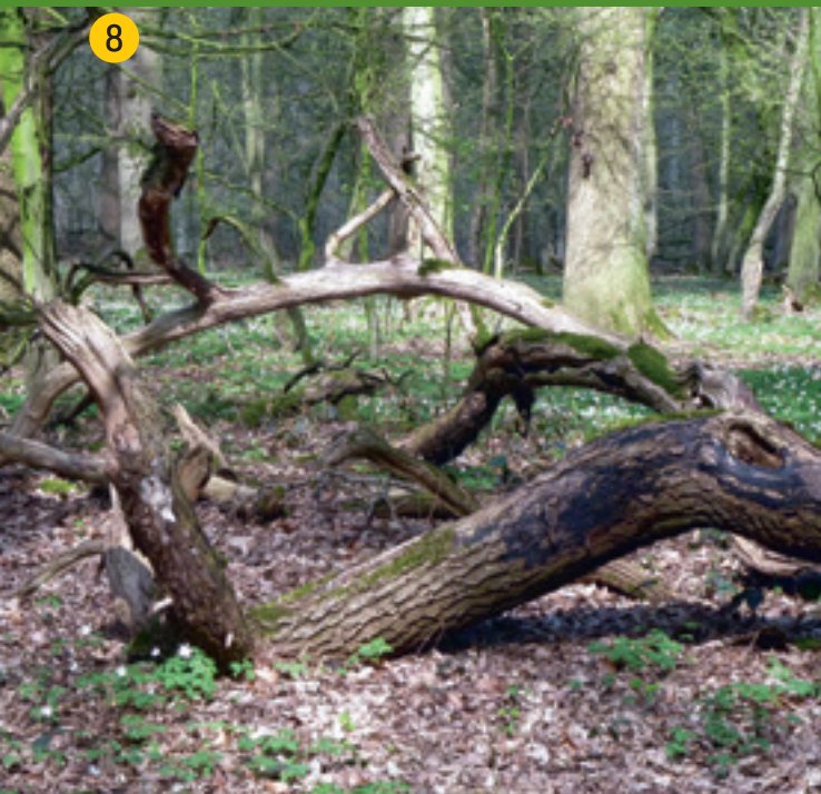
Natürlicher Alt- und Totholzreichtum ist charakteristisch für forstlich nicht genutzte Wälder. Damit kehrt der Artenreichtum zurück, der dem Wirtschaftswald fehlt.